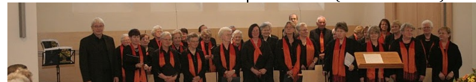
Der ökumenische Singkreis

18. September (Gründungstag der Kantorei vor 27 Jahren): Die Kantorei singt u.a. die Kantate „Danket dem Herrn“ (G. Ph. Telemann).