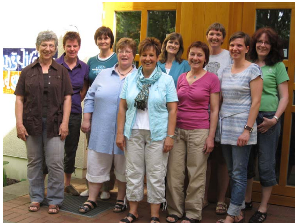
Die Erzieherinnen des Familienzentrums Evangelischer Kindergarten, Tempeliner Allee 12

Liebe Gemeindemitglieder, liebe Leser und Leserinnen,