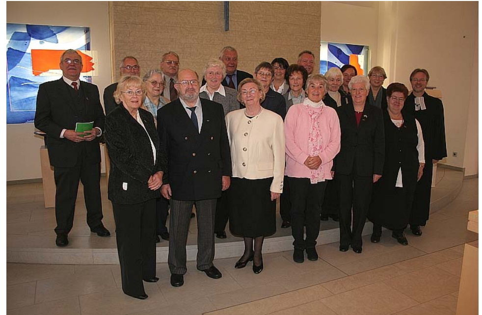
Die Konfirmandinnen und Konfirmanden der Jahrgänge 1947 und 1957.