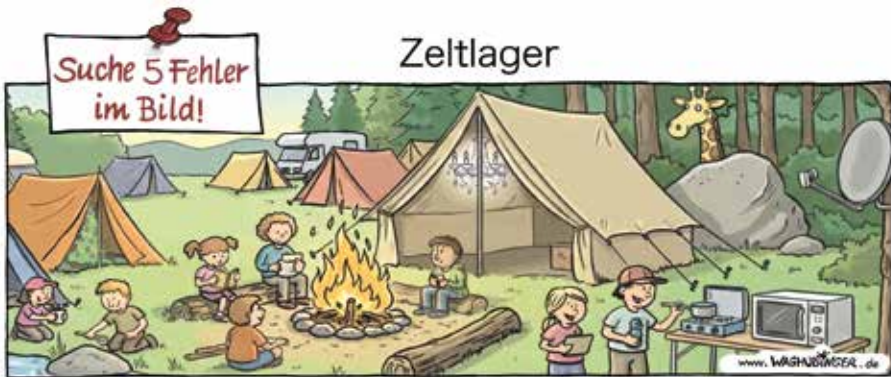
Tannenbaum, Kronleuchter, Giraffe, Mikrowelle, Satellitenschüssel