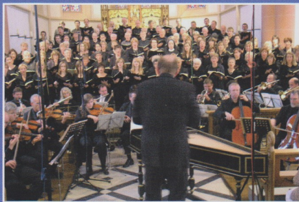
• Gagen für Orchester / Solisten