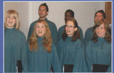
• Musikalische Gäste