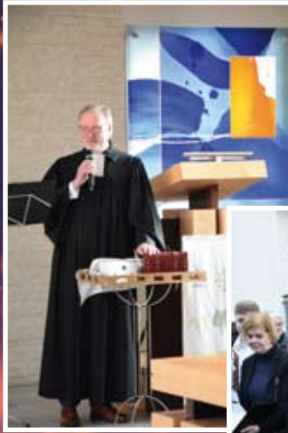
Foto links: „Ich habe da mal was vorbereitet...“ – Schatztruhen veranschaulichten die Predigt.

Foto unten: Viele Mitglieder der Gemeinde nutzten die Gelegenheit zu Dank und guten Wünschen.