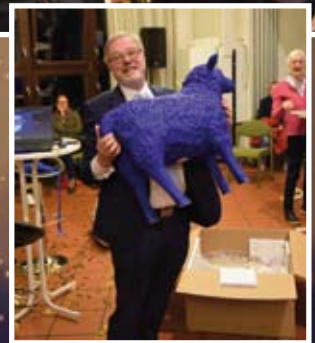
Ein Pfarrer zukünftig ohne Gemeindeglieder braucht natürlich, zumindest ein Schaf – und sei es ein blaues.