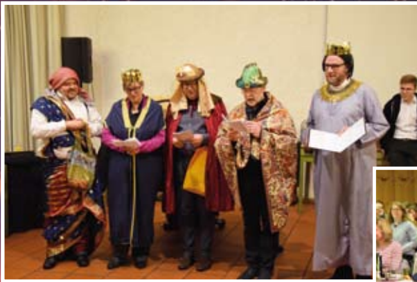
Foto links: Die Kollegen aus der Region West – hier als „Könige aus dem West-Land“...