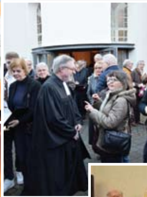
Foto unten: Viele Mitglieder der Gemeinde nutzten die Gelegenheit zu Dank und guten Wünschen.

Foto links: „Ich habe da mal was vorbereitet...“ – Schatztruhen veranschaulichten die Predigt.