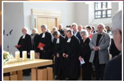
Kein Platz blieb leer in der vollbesetzten Kirche.