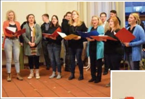
Der Chor Sunbeam –verbreitete Licht und Wärme.