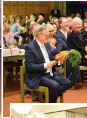
Foto links : ... überbrachten Möhren. Eine bodenständige Interpretation von Gold Weihrauch und Myrrhe.