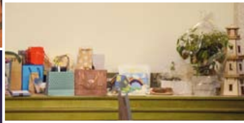
Foto rechts: Auch der Ge- schenke-Tisch bog sich zum Schluss unter der Vielzahl der Abschieds-Präsente.